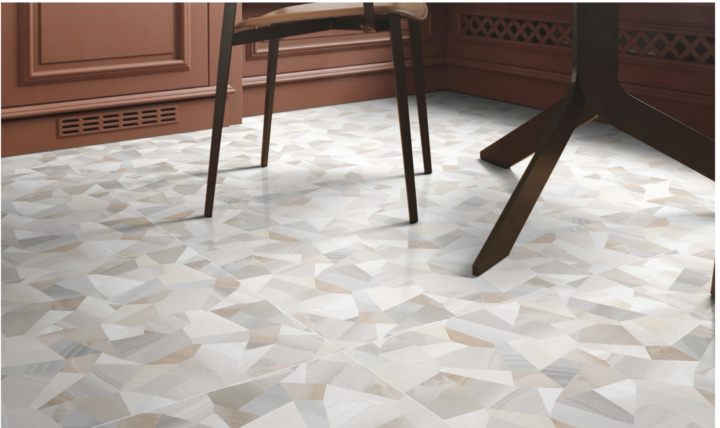
MILANO DÉCOR Ambra (Beige)