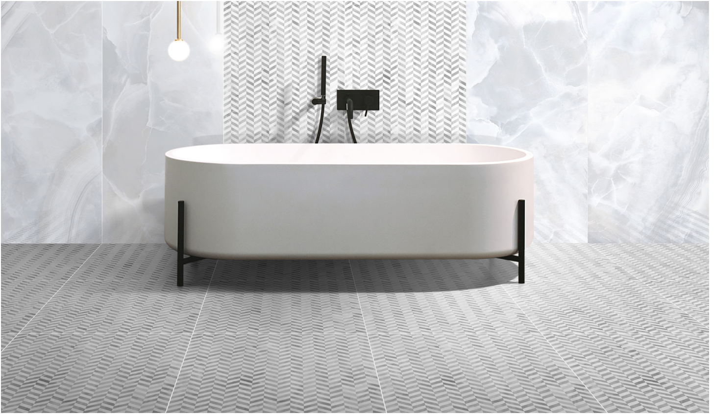
SIMILA DÉCOR Bianco (Blanc)